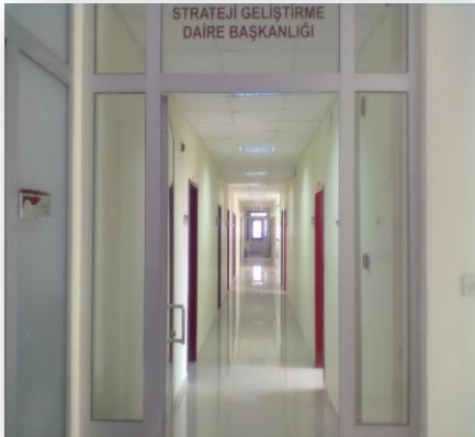
Tablo 1 Ofis alanları